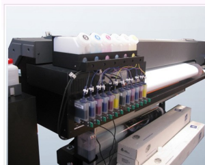
●ローランドインク供給システム