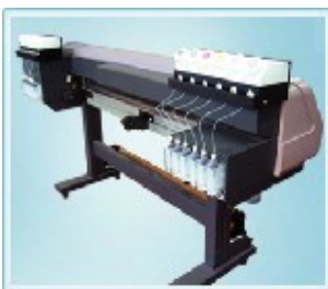
●JV4インク供給システム