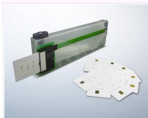
●武藤用インク供給システム